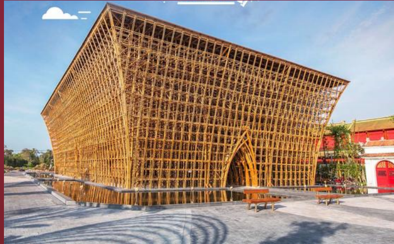
Bamboo Legend Bamboo House Project LARGEST IN VIETNAM