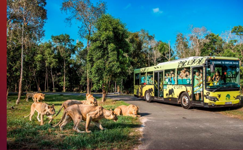
Vinpearl Safari Semi-wild zoo LARGEST IN VIETNAM