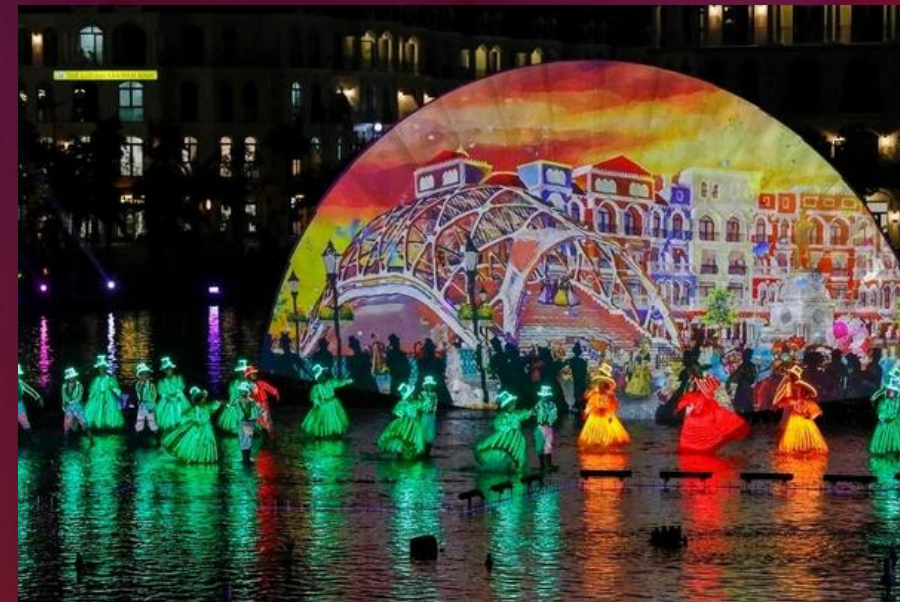
Colors of Venice Multimedia live show on water inspired by the quintessence of European culture LARGEST IN VIETNAM