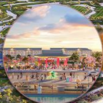
Công viên H-PARK