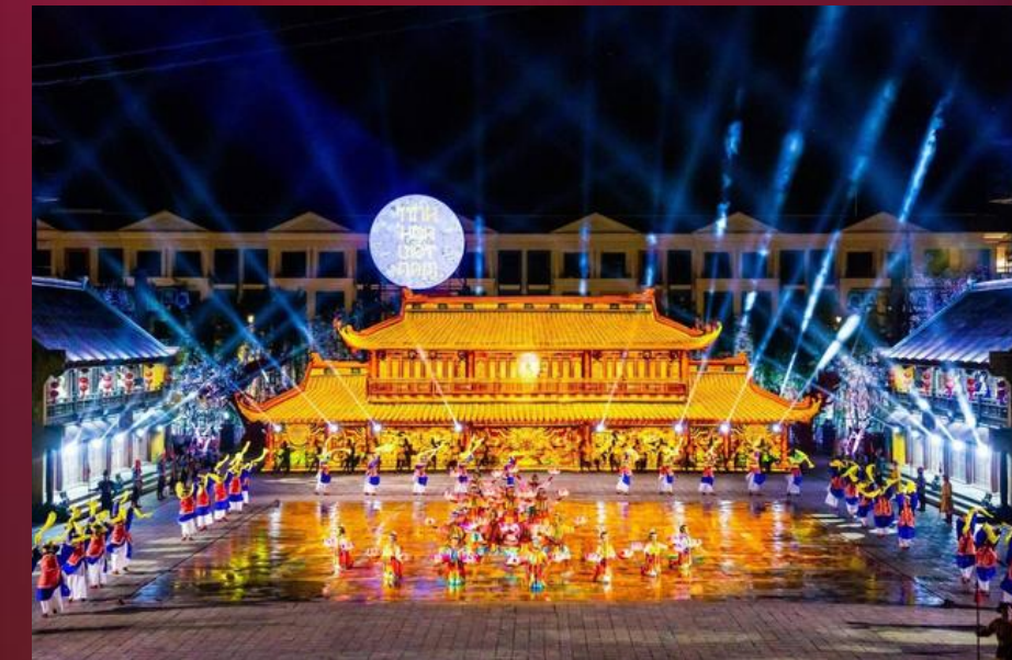
The Quintessence of Vietnam Live show using 3D performance technology to recreate traditional historical relics of Vietnam MOST