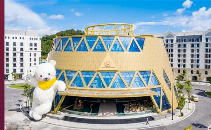
Teddy Bear Museum The FIRST Teddy Bear display area in Vietnam