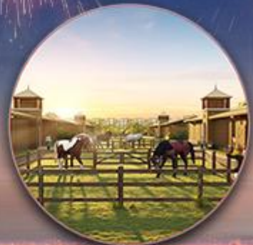
Học viện cưỡi ngựa HORSE ACADEMY