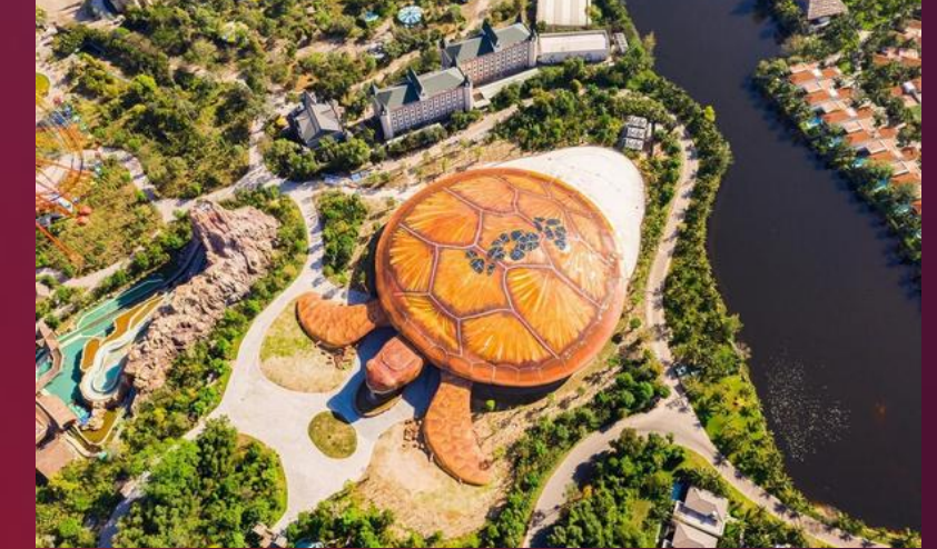
Neptune Palace Turtle Aquarium THE WORLD'S LARGEST