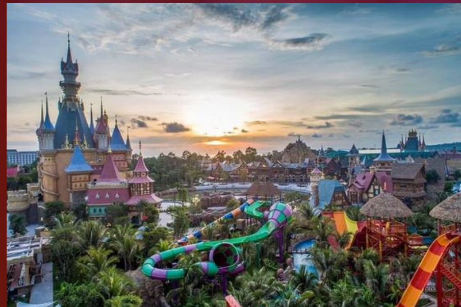
VinWonders Phu Quoc Theme park LARGEST IN VIETNAM, TOP IN ASIA