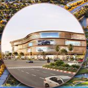
Trung tâm thương mại VINCOM MEGA MALL