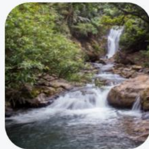
Thác Tà Pú