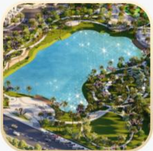
Hồ trung tâm 6.000 m 2