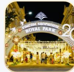
Phố hoa ánh sáng Châu Âu