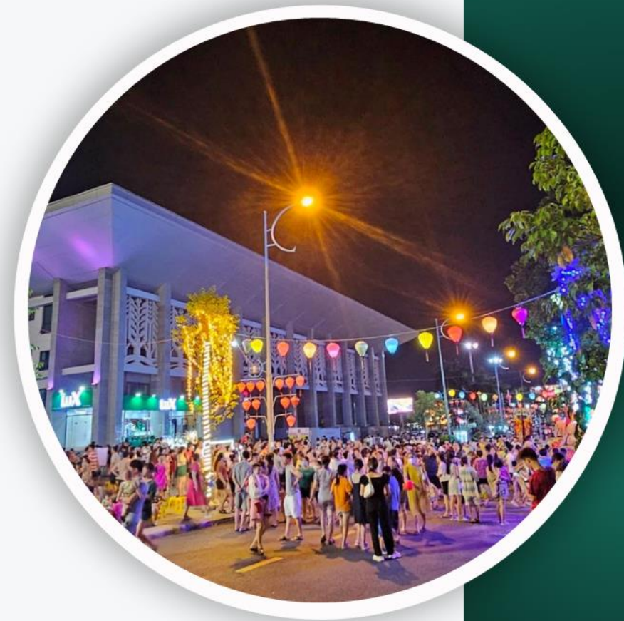
Tuyến phố đêm tại khu vực quảng trường Trung tâm Văn hóa - Điện ảnh tỉnh vào thứ 7 hàng tuần.

CƠ HỘI KINH DOANH BỨT PHÁ ĐÓN ĐẦU CHO CÁC NHÀ ĐẦU TƯ CHIẾN LƯỢC