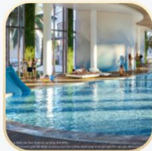
Bể bơi 4 mùa