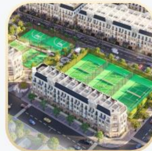
Công viên thể thao