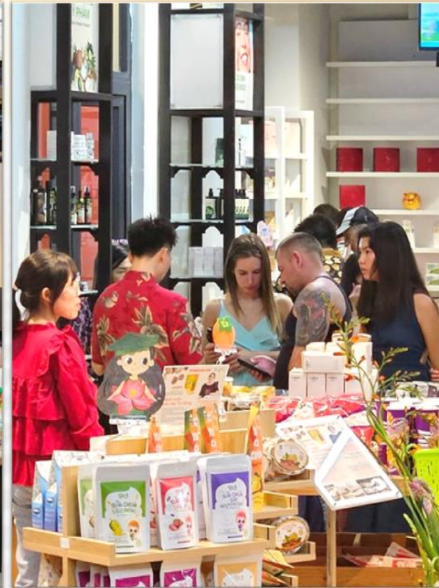
Mua sắm đa dạng