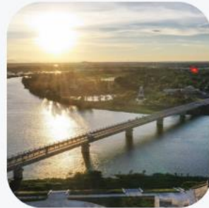
Cầu Hiền Lương