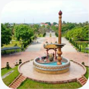
Thành cổ Quảng Trị