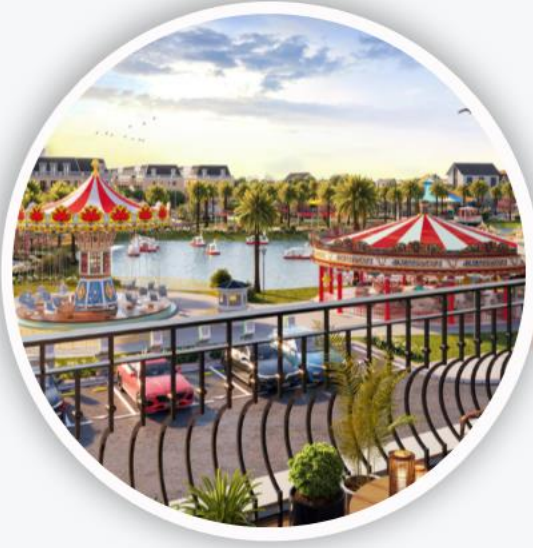
Công viên giải trí VinWonders thu nhỏ