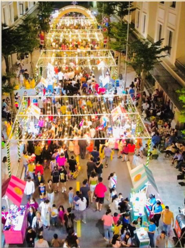
Phố đi bộ nhộn nhịp