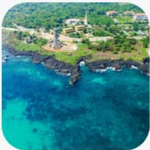
Đảo Cồn Cỏ