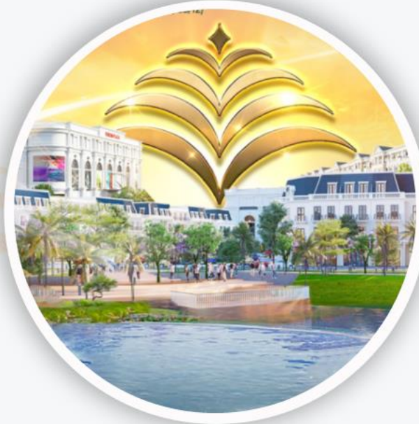
KPTM VCSH Đông Hà Royal Park & Vincom Plaza Đông Hà