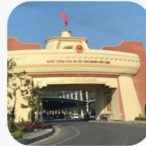
Cửa khẩu Lao Bảo