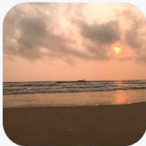
Bãi biển Cửa Việt