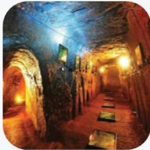
Địa đạo Vịnh Mốc