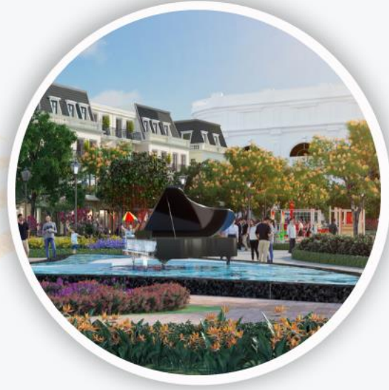
Công viên sinh thái xanh mát