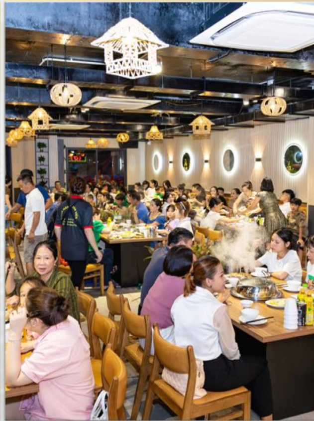
Ẩm thực độc đáo