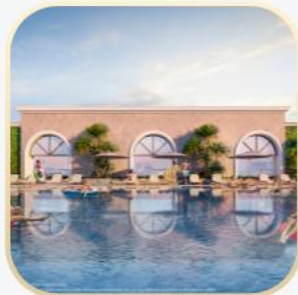
Bể bơi trên cao ngoài trời