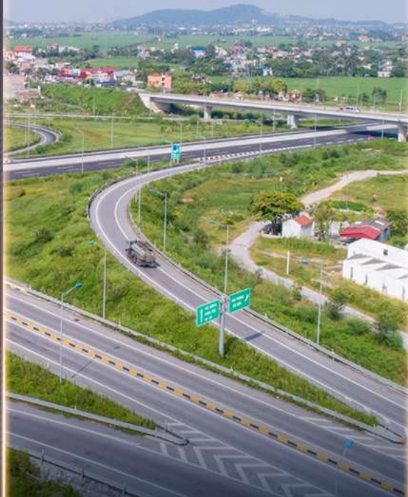
INVESTMENTS IN EXPRESSWAYS AND ADDITIONAL REST STOPS ALONG THEM