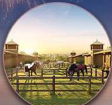
Học viện cưỡi ngựa HORSE ACADEMY