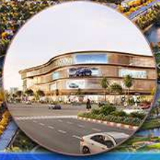
Trung tâm thương mại VINCOM MEGA MALL