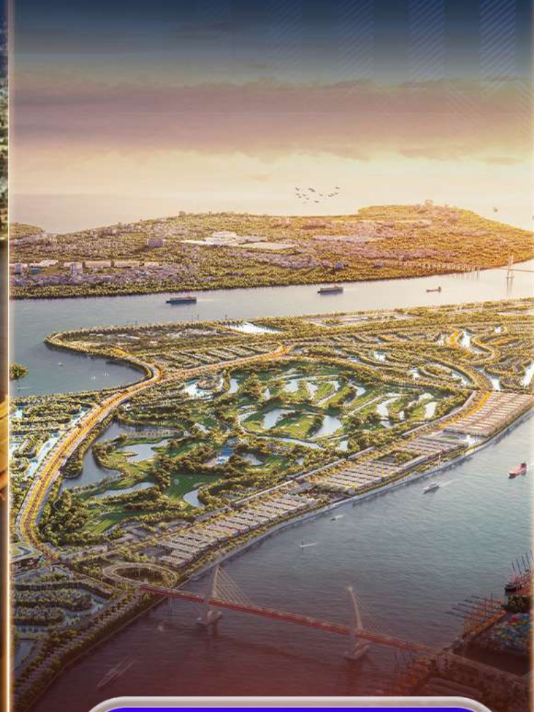
NEW AND PREMIUM TOURISM OFFERINGS