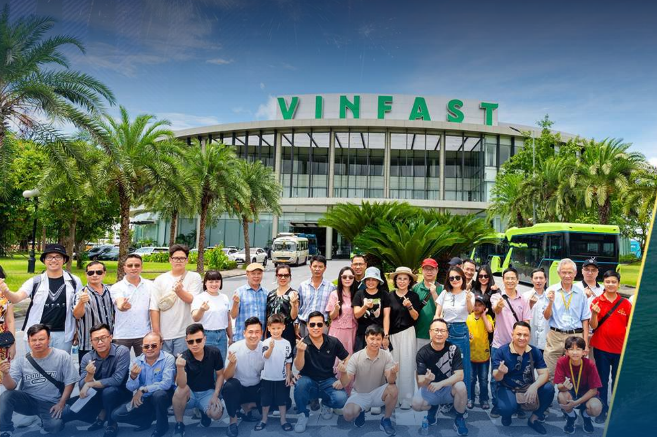
INTERNAL GROUP TOURS AND PROGRAMS OF PNL COMPANIES IN VINGROUP