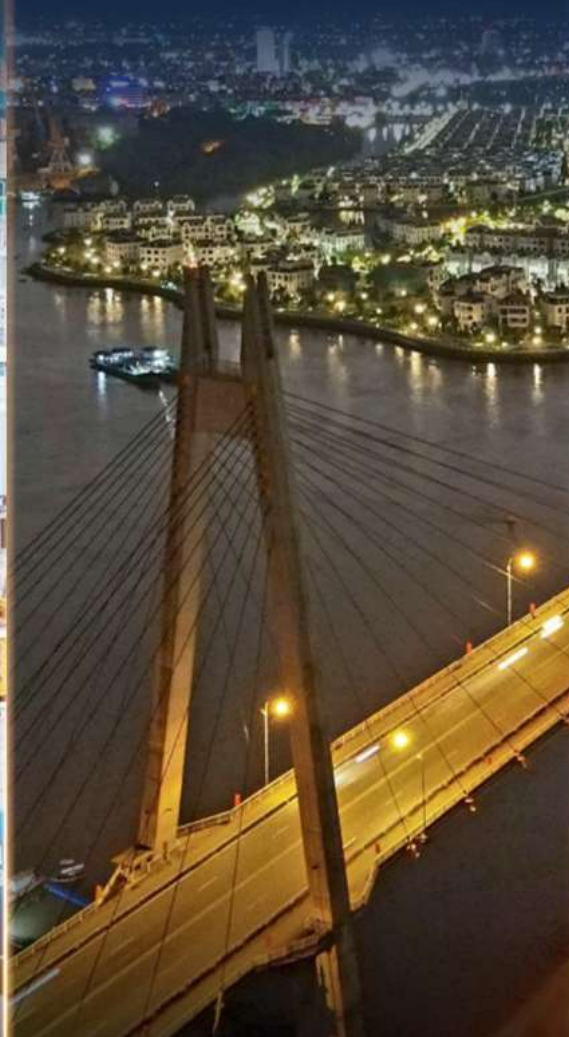
CONSTRUCTION OF BRIDGES LINKING THE CITY CENTER TO TOURIST SPOTS