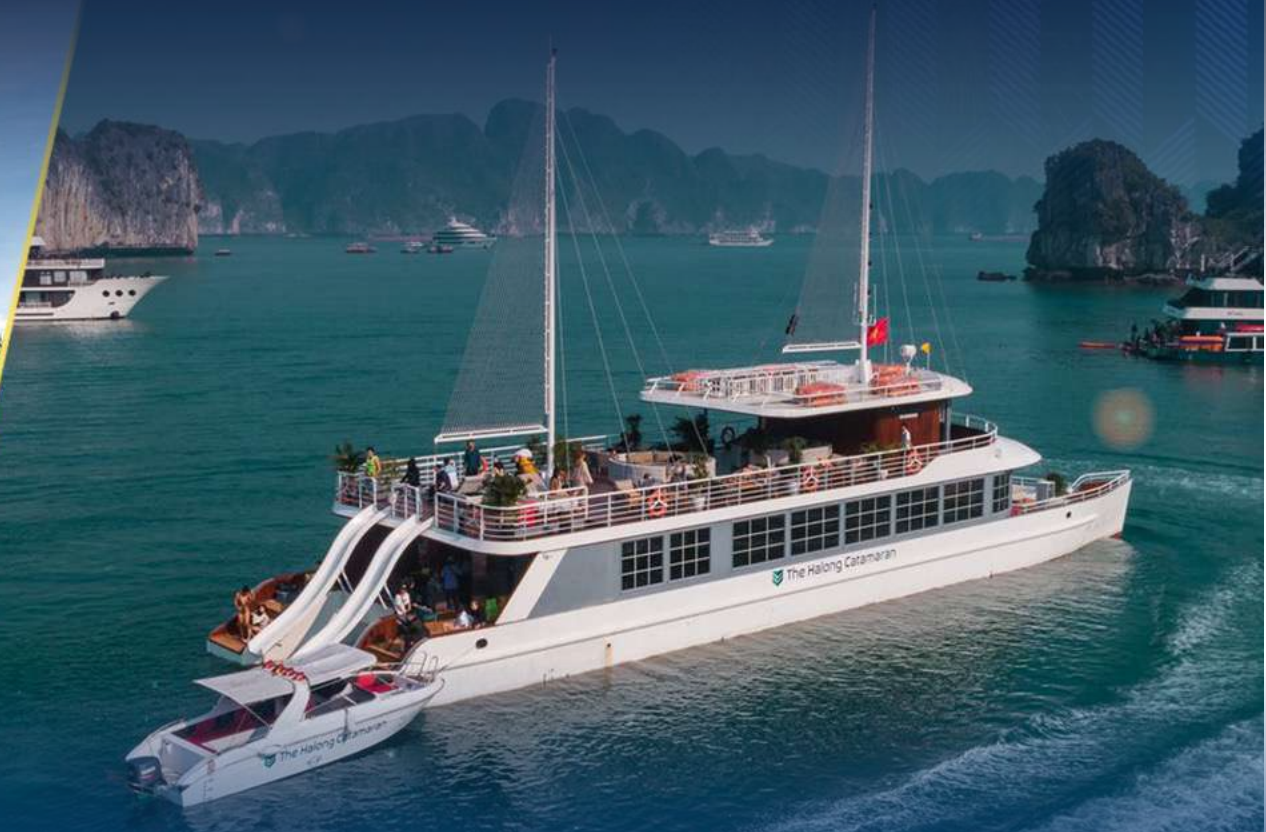
GROUP TOURS AND FAMTRIPS CONNECTING WITH TOURISM ORGANIZATIONS