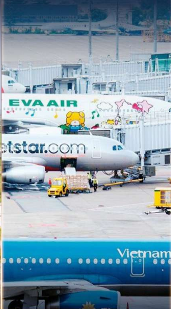
INTRODUCTION OF DIRECT FLIGHTS TO CAT BI AIRPORT