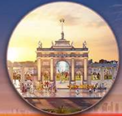
Quảng trường Châu Âu ROYAL SQUARE