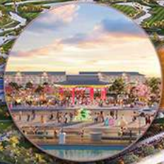
Công viên H-PARK