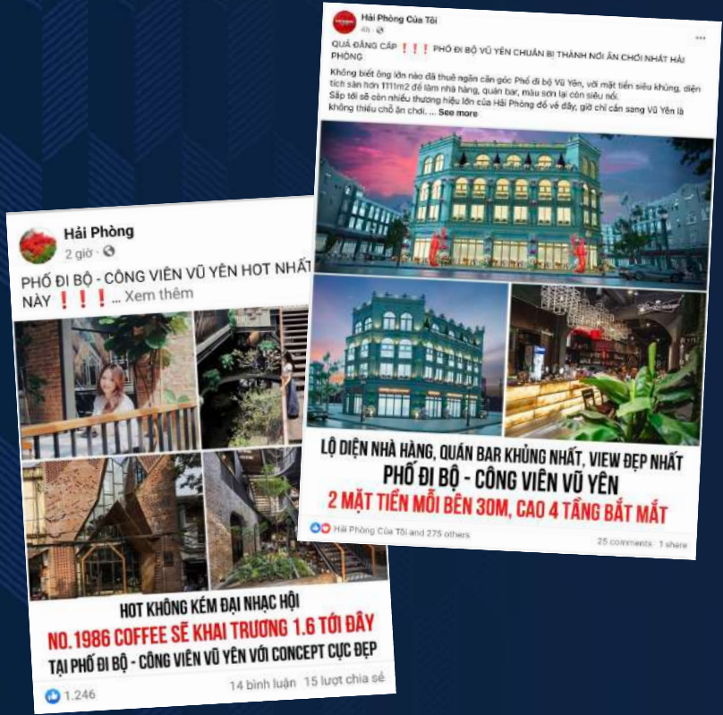
브랜드를 위한 게시물을 대형 SNS 팬페이지와 그룹에 게시