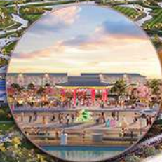
Công viên H-PARK