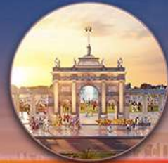
Quảng trường Châu Âu ROYAL SQUARE