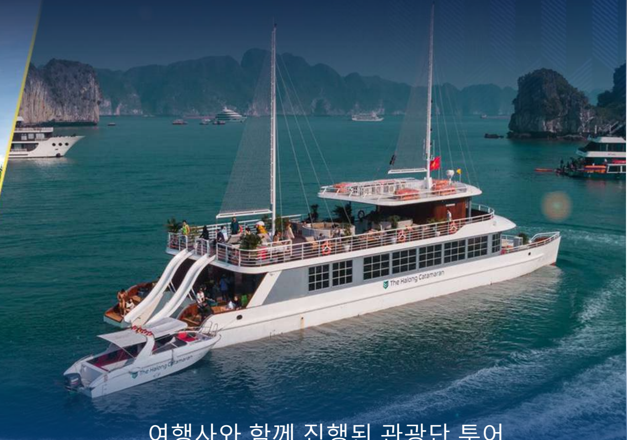
여행사와 함께 진행된 관광단 투어 및 경험 여행