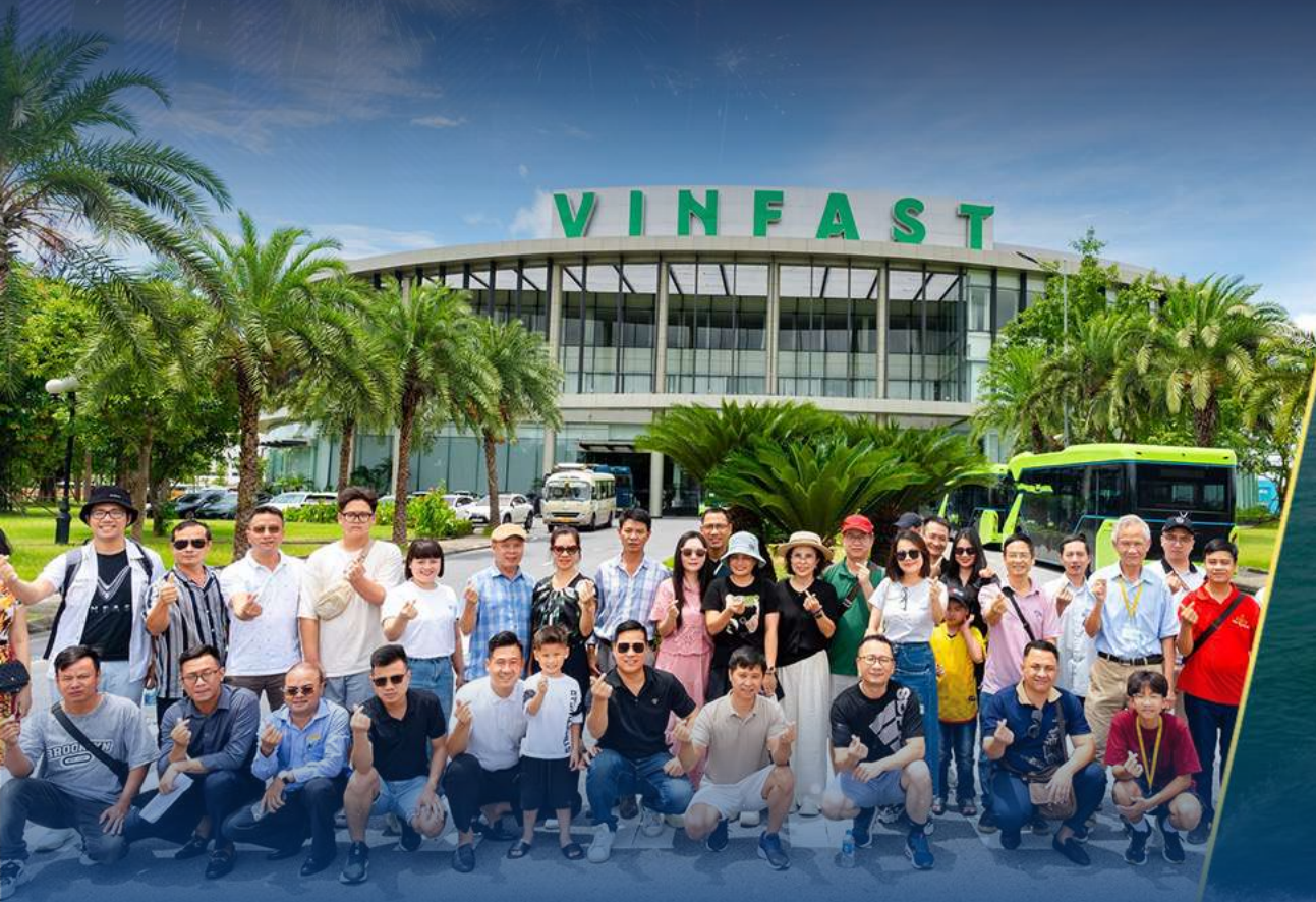
내부 투어와 PNL 프로그램