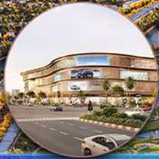
Trung tâm thương mại VINCOM MEGA MALL