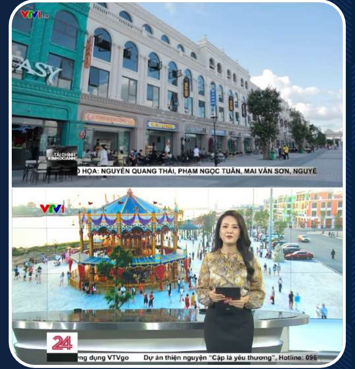
신문과 방송에서 뉴스 보도