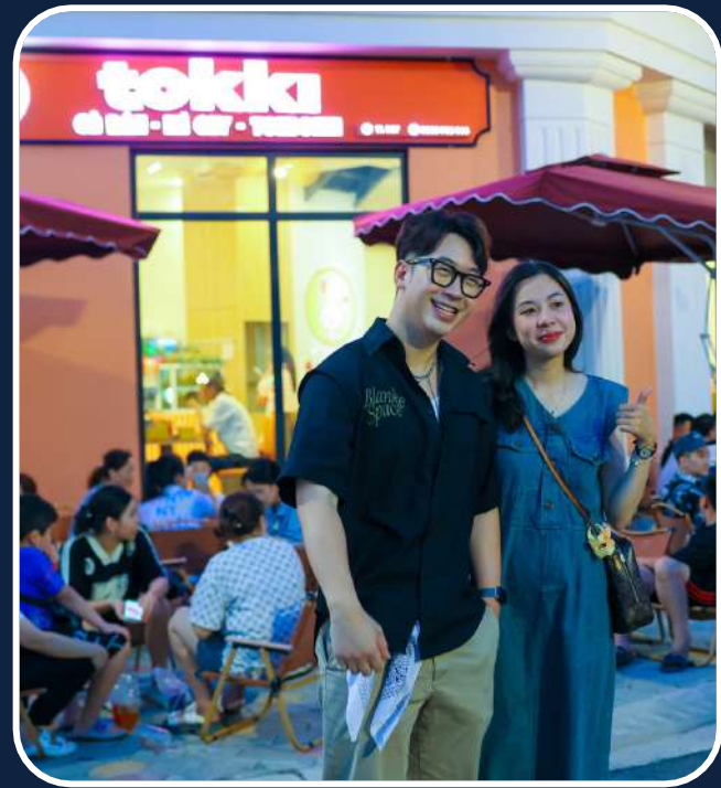
KOL 및 KOC를 통한 브랜드의 상품 리뷰