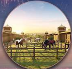
Học viện cưỡi ngựa HORSE ACADEMY