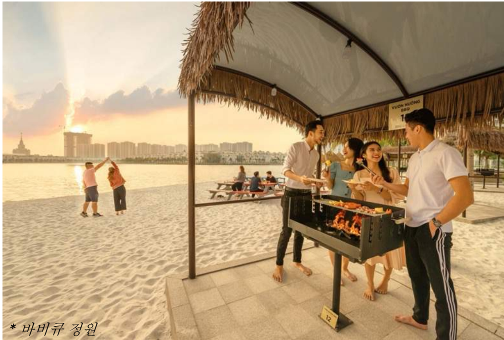
* 바비큐 정원