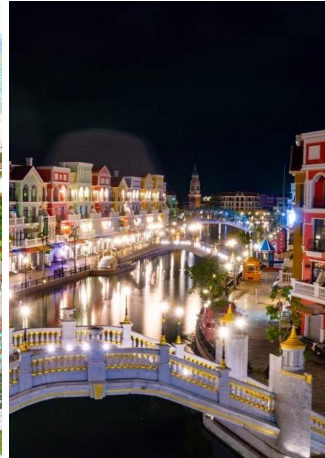
그랜드 월드 푸꾸옥