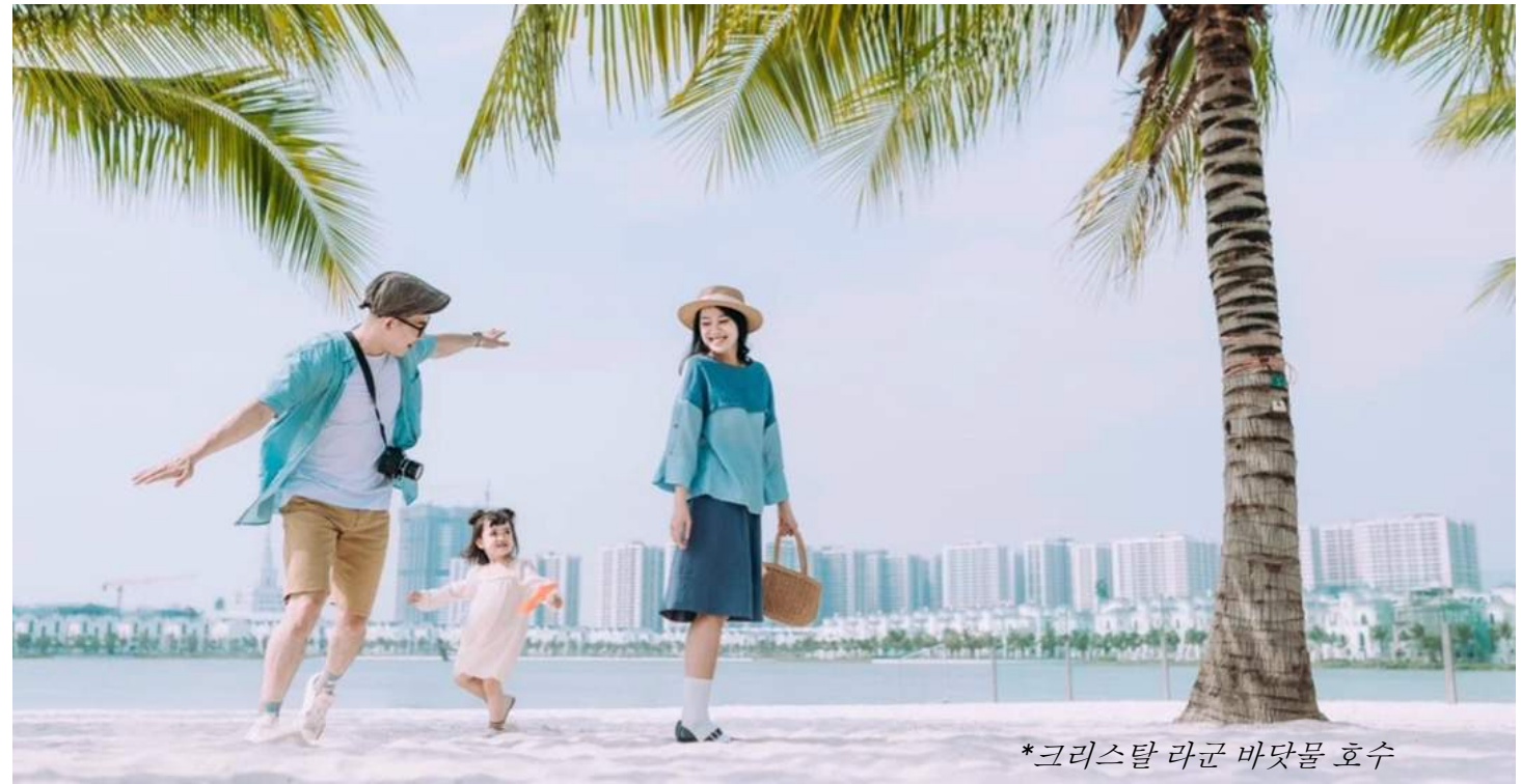
*크리스탈 라군 바닷물 호수