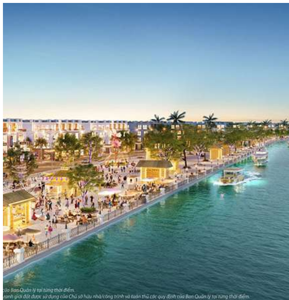
Chỉ Báo Quản lý tại hàng thời điểm. Hình ảnh được sử dụng của Chủ sở hữu nhà/công trình và tuân thủ các quy định của Ban Quản lý tại từng thời điểm.

Đơn vị có kinh nghiệm bán lẻ 20 năm phát triển và quản lý 83 TTTM Vincom, 5 Khu phố thương mại trên toàn quốc , đồng hành phát triển cùng khách thuê từ giai đoạn setup đào tạo nhân viên đến khi vận hành chính thức